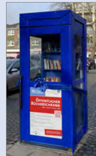
Bücherschrank am Hohenzollerplatz in Neumühl

Wo genau? Alle Adressen und Standorte finden Sie unter www.du-liest.de